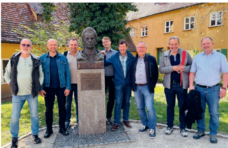
Die Vorstände der Fürther Wohnungsgenossenschaften besuchten die älteste Sozialsiedlung der Welt, die Fuggerei in Augsburg.

Die vier Fürther Wohnungsbaugenossenschaften unternahmen unter dem Motto „Genossenschaftlicher Austausch“ eine gemeinsame Exkursion nach Augsburg.