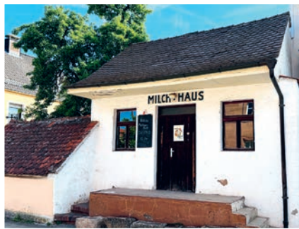
Das Milchhaus in der Bachstraße.

örtlichen Landwirte, sondern war auch ein wichtiger sozialer Knotenpunkt, an dem Neuigkeiten ausgetauscht wurden. Nachdem diese ursprüngliche Nutzung entfiel, hat es sich der Heimatverein Oberasbach e.V.