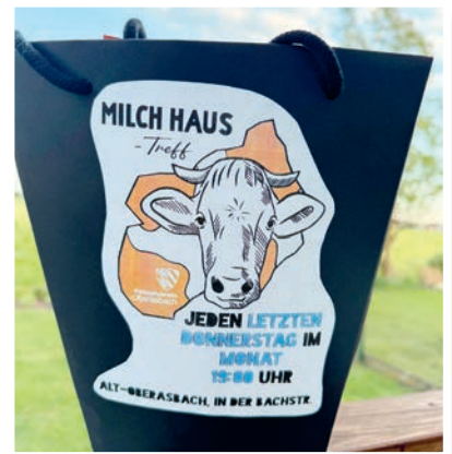
Jeden letzten Donnerstag im Monat trifft man sich am Milchhaus.

zur Aufgabe gemacht, das Gebäude zu reaktivieren und den historischen Charme des Altorts zu bewahren.