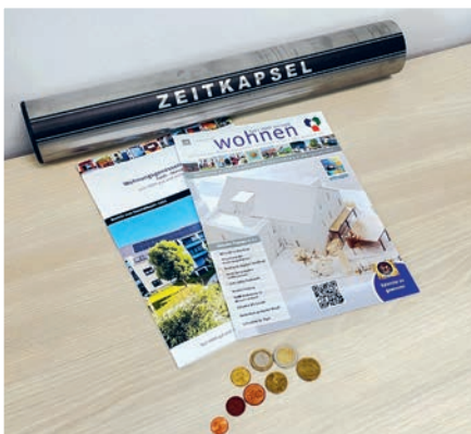
Die Zeitkapsel enthält den aktuellen Geschäftsbericht, die Mieterzeitung und Euro-Münzen.