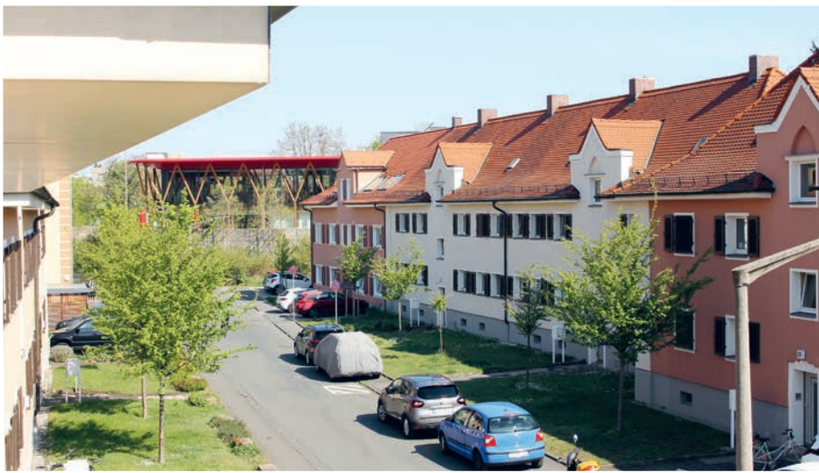
Historische Widderstraße aus dem Jahr 1926, nun mit einer Dachbodendämmung versehen (Bild rechts).