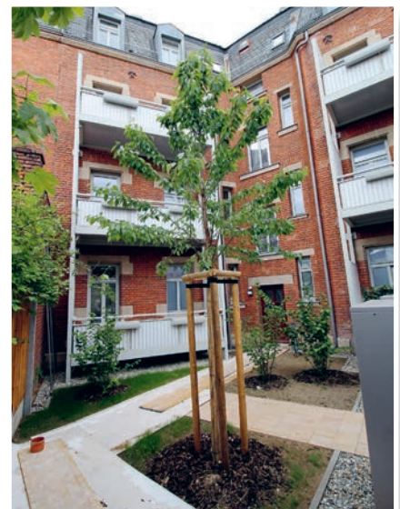
Die Zierkirsche im Hof der Erlanger Str. 36.

Die neuen Bewohner können sich darauf freuen, wenn er im nächsten Frühjahr erstmals in voller Blüte steht und den Hof in ein rosa Blütenmeer verwandelt.